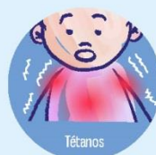
Tétanos Paralysie, décès