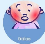
Oreillons Méningite, atteintes testiculaires