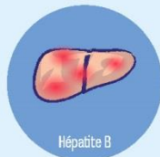
Hépatite B Cirrhose, cancer