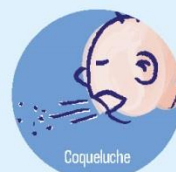
Coqueluche Détrese respiratoire, décès