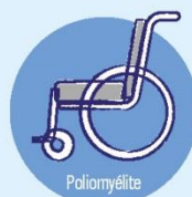
Poliomyélite Paralysie, décès