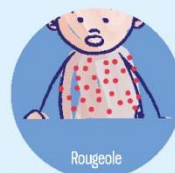
Rougeole Encéphalite, pneumonie, décès