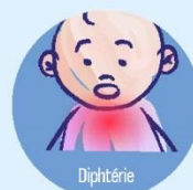
Diphthérie Asphyxie, décès