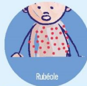
Rubéole Malformations foetales