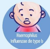
Haemophilus Influenzae de type b Méningite, décès

Plus de 70% des enfants en France sont déjà vaccinés contre ces 11 maladies.