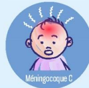
Méningocoque C Méningite, amputations, décès